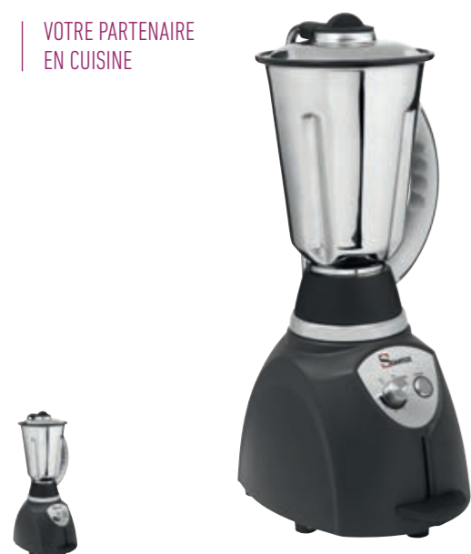
37 41 Grey Gris Santosafe kitchen blender painted base 37 Blender de cuisine Santosafe socle peint 37