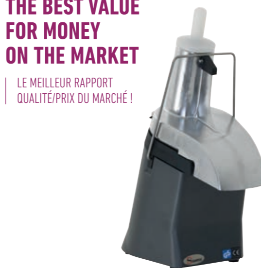
48 Grey Gris Vegetable slicer with high output Delivered with 3 standard discs: Slicer T3, Grater R3, Shredder E8. A wide range of discs available on demand Coupe légumes à gros débit Livré avec 3 disques standards : Trancheur T3, Râpe R3, Effileur E8. Une large gamme de disques disponibles sur demande