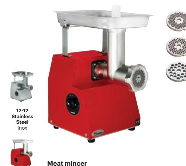
12-12 Stainless Steel Inox 12-12R Red Rouge Meat mincer Stainless steel body. Delivered with 3 plates Ø 70 mm Hachoir à viande corps inox Livré avec 3 grilles Ø 70 mm