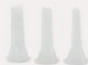
Set of 3 sausage cones Jeu de 3 cornets à saucisses Ref #12804