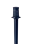
Chef Stick Chef Stick Ref #37110